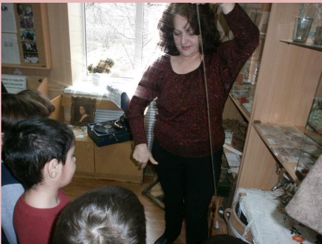
Так делают нитки из шерстяной пряжи