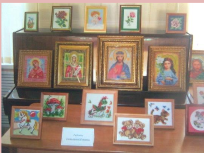
Работы семьи Томилиных