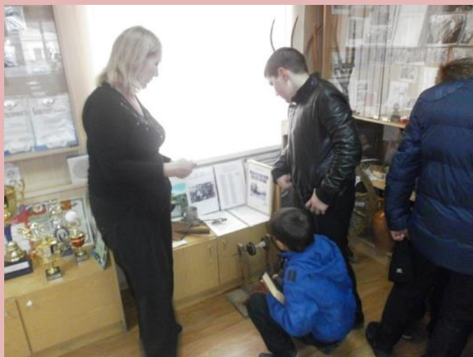
Экскурсия по музею